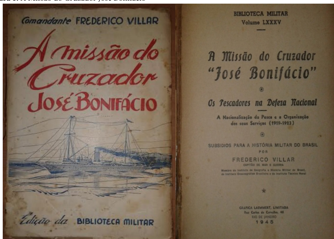
Figura 1. A Missão do Cruzador José Bonifácio

Fotografia da capa e folha de rosto de VILLAR (1945).